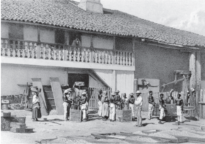
Encaixotamento e pesagem do açúcar. Victor Frond. Litografia de Ph. Benoist. Ilustração do livro Brasil Pitoresco , 1860.

vadores. Em muitos casos, o apego às belas paisagens suplantou o interesse pelas especificidades da natureza americana. 23