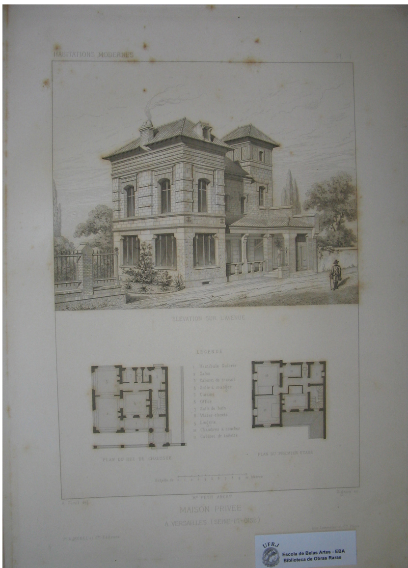
Figura 3 - Maison privée à Versailles (Seine et Oise). VIOLLET-LE-DUC, E. Habitations modernes . 1ère Partie. Paris: Vve. Morel et Cie Libraires-Éditeurs, 1875, pl 1.

publicação que tem por tema o próprio ensino de arquitetura na École des Beaux-Arts – avaliações ou “concursos” mensais, prêmios de viagem – e ainda livros escritos