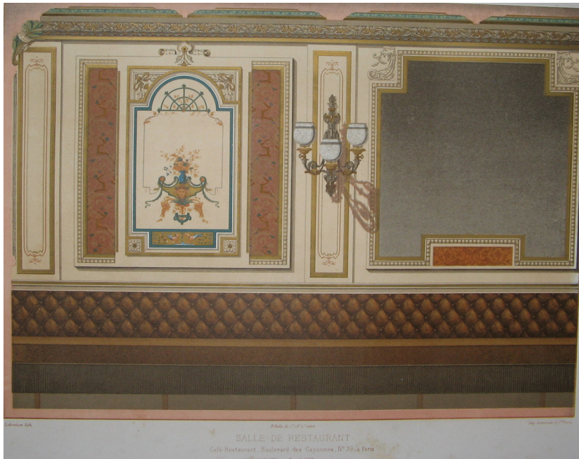
Figura 2 - Salle de Restaurant. DALY, C. Décorations Intérieures Peintes . Paris: Ducher et Cie, 1877, s/p.

A história não poderia estar ausente desse conjunto de referências para o ensino oitocentista: além dos inventários sobre a Antiguidade, a maior parte deles datando do século XVIII e início do XIX, se encontram livros de história da arquitetura e das artes decorativas já formatados segundo o método historicista da classificação estilística, por vezes complementada pela localização geográfica; outro tipo de historiografia são as monografias sobre determinados monumentos ou cidades.