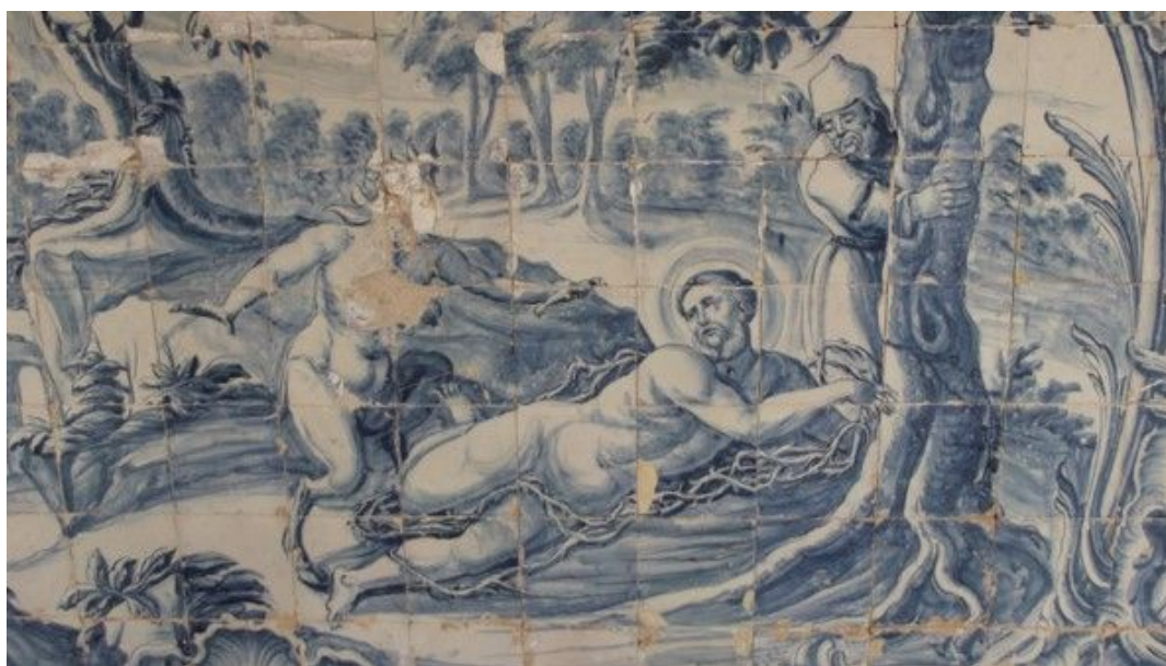
Figura 2. Anônimo. Tentado pela luxúria, São Francisco se lança sobre espinhos, ca. 1743. 19 x 19 azulejos. Claustro do Convento de Nossa Senhora das Neves, Olinda. [Detalhe].

No painel do claustro de Olinda, que espelha a gravura, Francisco aparece completamente nu, deitado sobre uma cama de espinhos, enroscando-se também os galhos espinhosos ao corpo do santo. Na imagem, o santo é figurado lançando um olhar desalentado para a figura demoníaca que o tenta. A cena é destacada