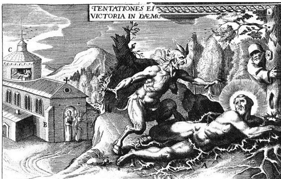
Figura 1. SADELER, Justus. Tentado pela luxúria, São Francisco se lança sobre espinhos. In: Seraphici patris S. Francisci ordinis minorum fondatoris admiranda historia... , ca. 1600. Gravura, 18,5 x 27 cm.

aparecem em outros livros de gravuras coevas com poucas variações iconográficas.