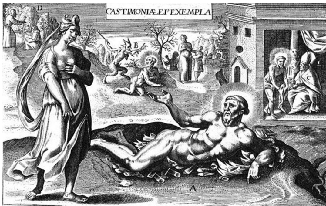
Figura 4. SADELER, Justus. Tentado pela luxúria, São Francisco se lança sobre o fogo. In: Seraphici patris S. Francisci ordinis minorum fondatoris admiranda historia..., ca. 1600. Gravura, 18,5 x 27 cm.

A cena em que Francisco se lança sobre o fogo, para reprimir a tentação da luxúria, também pode ser vista no Brasil, nos conjuntos azulejares dos conventos franciscanos das cidades pernambucanas de Olinda e de Sirinhaém, ambos produzidos em meados do século XVIII. A pertinência da produção de tais imagens para igrejas e conventos da América Portuguesa pode ser inferida dos relatos dedicados às tentações carnis presentes na conhecida Crônica do Frei Jaboatão; franciscano que na mesma época escrevia sobre as “disciplinas” às quais os frades deveriam se impor para conter os desejos da carne, inclusive pelas índias 22 . Essa preocupação com os pecados da carne aparece também nos Estatutos da Província de S. Antônio do Brasil , impressos em Lisboa em 1709 23 .