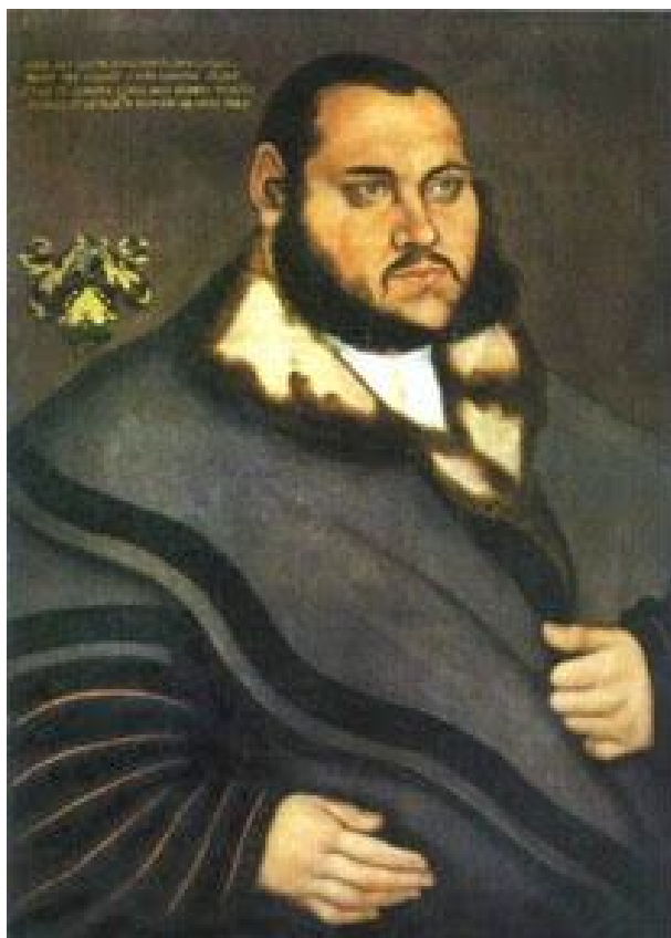
Figura 1. Retrato de Johannes Carion Lucas Cranach, o velho C. 1530 Berlim, Staatliche Musee zu Berlin (Gemäldegalerie)

No que se refere a Lutero, sua abordagem sobre a condição astrológica sobre a visão cosmológica de mundo sempre foi de repúdio e crítica agressiva sobre o impacto das instâncias cosmológicas no cotidiano do homem. Porém, Lutero aceita – de certa forma – aquele centro astrológico-místico onde era visto como “um prodígio da natureza”, enviado soberana e imponderavelmente pela onipotência do Deus cristão como admoestação pressagiadora (...)” 9 .