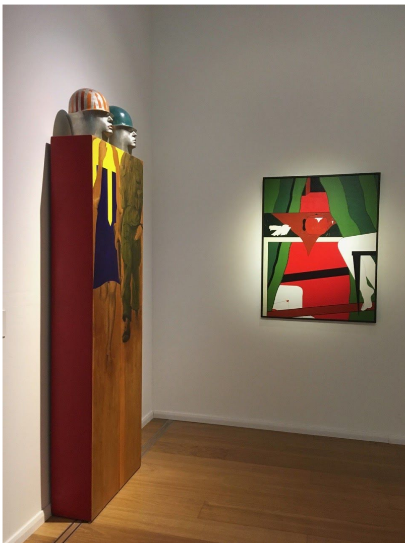
Fig. 2. Obras de Marisol Escobar e Wanda Pimental na seção Conceitualismos políticos – exposição Arte Latinoamericana 1900-1970 Colección Malba, setembro de 2019.