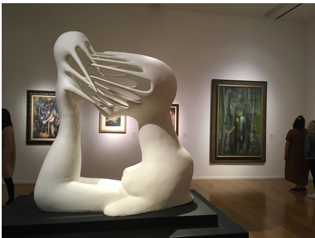
Fig. 1. Visão da seção Realismo mágico e surrealismos – exposição Arte Latinoamericano 1900-1970 Colección Malba, setembro de 2019.

fora das fronteiras francesas. Embora na América Latina a representação do fantástico já existisse arraigada nos costumes, lendas e mitologias ancestrais, é certo que o surrealismo bretoniano avivou aqueles fatos e instou aos artistas modernos a explorar suas raízes e também seu próprio inconsciente". Nela vemos trabalhos de artistas como os brasileiros Maria Martins e Cícero Dias, o chileno Roberto Matta, o cubano Wifredo Lam e a espanhola, radicada no México, Remedío Varos, sem maiores explicações sobre sua efetiva relação com os princípios do surrealismo francês ou sobre sua especificidade nos contextos locais.