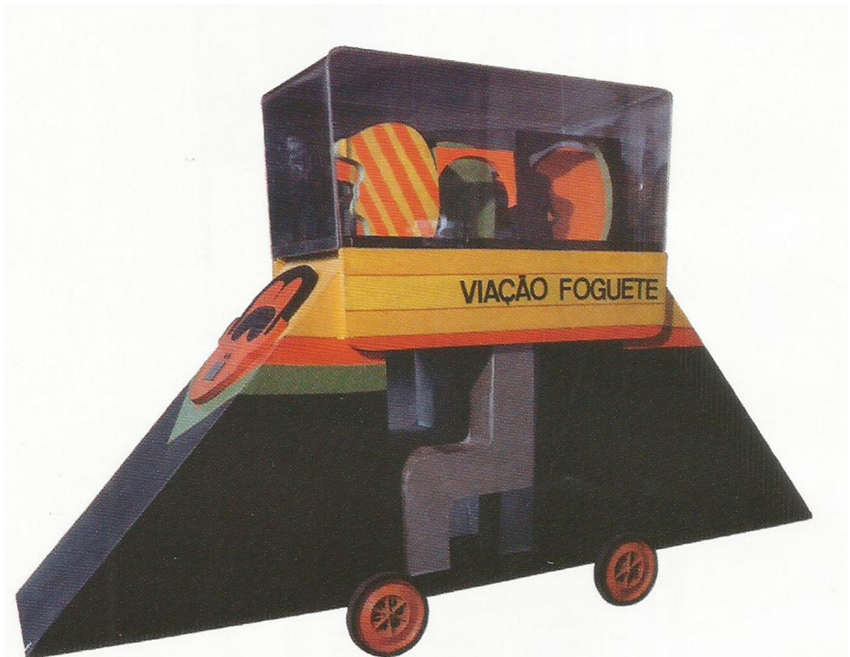
Fig.1. Rubens Gerchman, Ônibus , 1967. Acrílica s/relevos em madeira. Coleção Gilberto Chateaubriand, no MAM/RJ. Fonte: MAGALHÃES, F. Rubens Gerchman , São Paulo: Lazuli, 2006, p.60.

Exemplo disso foi a marcante participação de ambos na coletiva inaugural da Galeria G-4, na Rua Dias da Rocha, em Copacabana (1966), empreendimento projetado por Sérgio Bernardes e dirigido pelo fotógrafo David Zingg (1923-2000), que marcou a virada na produção desses artistas com propostas experimentais, interativas e lúdicas. Por remeterem a ingênuos brinquedos infantis, a ironia ao poder acabaria não sendo compreendida pelos censores.