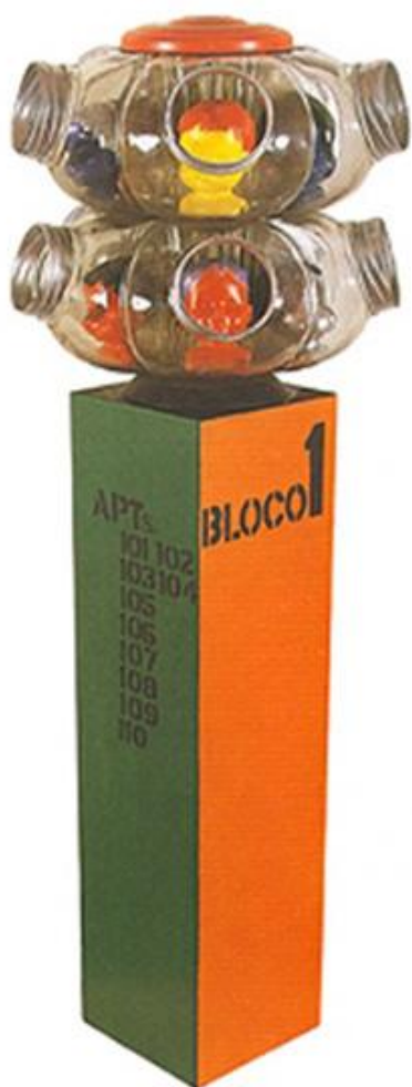
Fig. 2. Rubens Gerchman, Baleira Caixa de Morar , 1966. Objeto em vidro, madeira e pvc.

Elevador de Serviço, Ditadura das Coisas . Nas pinturas e desenhos anteriores, os ônibus eram representados em estranhos cortes, que permitiam ver o interior apinhado de figuras humanas, esquemáticas e anônimas, com expressões grotescas, como nos desenhos transparentes das crianças. Aludia, ironicamente, ao preconceito, à estratificação social, aos projetos e às mazelas sociais do governo ditatorial. Os Ônibus exibidos na galeria G4, construídos em madeira e lembrando brinquedos populares, faziam referência à substituição do transporte ferroviário (trens e bondes), pelo rodoviário. As Caixas de Morar ironizavam o projeto de construção de moradias coletivas, financiadas pelo Banco Nacional de Habitação (BNH), criado em 1964. O público que ocorreu a essa exposição foi incentivado a tocar, vivenciar e até a destruir os objetos, depois que o próprio artista e os demais expositores empurraram um insólito ônibus de madeira pelo espaço expositivo.