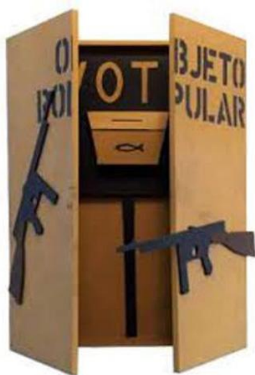
Fig. 6. Pedro Escosteguy, Objeto Popular (Vote) , 1966. Objeto de madeira e tinta acrílica. Coleção Sérgio Fadel, RJ. Disponível em: https://galeriasuperfície.com.br/artistas/pedro/escosteguy . Acesso: 21 set. 2021.

Para referir-se à interdição das eleições diretas pela ditadura e o direito de votar, o artista apresentou na G4, Objeto Popular (1965): objeto de madeira em forma de armário, suspenso na parede, fechado por duas portinholas, sobre as quais duas metralhadoras, recortadas em madeira ganhavam destaque. Se abertas as portas, as armas desapareciam, mas via-se no interior do armário uma urna eleitoral, com a palavra “vote”. Se nessa mostra o objeto não sofreu qualquer interdição, pouco antes, ao participar de Ponto de Vista (1966) na galeria Convivium, em Salvador, a censura, ameaçou retirar a obra, mas consentiu que permanecesse exposta, depois de lacrar as portas para mantê-las fechadas, o que não deixa de ser uma grande ironia, pois para o regime uma urna eleitoral era mais ameaçadora do que duas metralhadoras apontadas para o público.