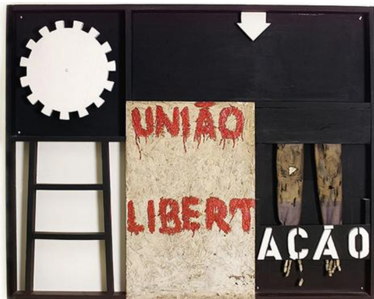
Fig. 5. Pedro Escosteguy, Linha de Força , 1965. Mista s/madeira, 150x120 cm. Reprodução Fotográfica Pedro Chiri. Fonte: http://enciclopedia.itaucultural.org.br/obra9627/baleira-caixa-de-morar-2 . Acesso: 30 jan.2022.

Para referir-se à interdição das eleições diretas pela ditadura e o direito de votar, o artista apresentou na G4, Objeto Popular (1965): objeto de madeira em forma de armário, suspenso na parede, fechado por duas portinholas, sobre as quais duas metralhadoras, recortadas em madeira ganhavam destaque. Se abertas as portas, as armas desapareciam, mas via-se no interior do armário uma urna eleitoral, com a palavra “vote”. Se nessa mostra o objeto não sofreu qualquer interdição, pouco antes, ao participar de Ponto de Vista (1966) na galeria Convivium, em Salvador, a censura, ameaçou retirar a obra, mas consentiu que permanecesse exposta, depois de lacrar as portas para mantê-las fechadas, o que não deixa de ser uma grande ironia, pois para o regime uma urna eleitoral era mais ameaçadora do que duas metralhadoras apontadas para o público.