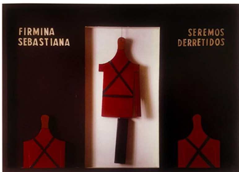
Fig. 4. Pedro Escosteguy, Estória/O fim da Idade do Chumbo , 1965. Pintura-objeto, 70 x 100 cm. Coleção Marília Escosteguy, Porto Alegre, RS. Fonte: in.com.br/escosteguy/obras/htm . Acesso: 30 jan.2022.

O poeta Pedro Escosteguy ao aderir às artes visuais em 1964, não bebeu na fonte da pintura pura. Produziu quadros/objetos interativos, em que misturava formas abstratas e palavras de ironia e denúncia política: Torturador (O Monstro) , 1964; Jogo (Roleta) , 1964; Estória/ O fim da Idade do Chumbo , 1965; Psicodrama , 1965; entre outros. Criava, assim, jogos lúdicos ou interativos, pondo em diálogo códigos visuais e semânticos, cujas palavras traduziam aquilo que os brasileiros não podiam falar.