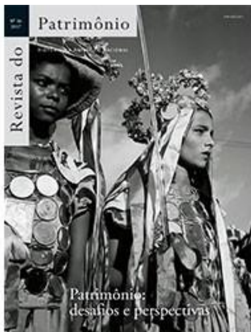
Capa Revista do Patrimônio nº36, c.2019.