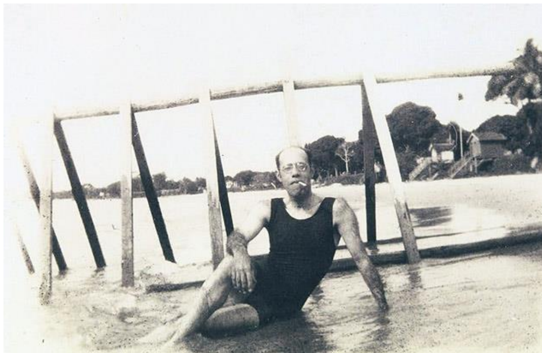
Mario de Andrade na Praia do Chapéu Virado, maio/1927. Fotografia.