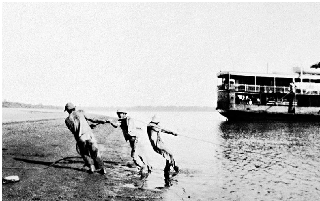
MARIO DE ANDRADE: Pescadores em Belém do Pará, c.1927. Fotografia.

Biblioteca de Estudos Brasileiros da USP – Universidade de São Paulo.